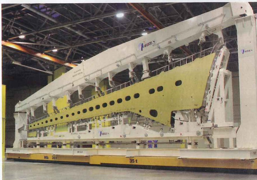
Primer ala del MS21 en la estación 01.41.

Nuevos clientes del sector aeronáutico y países como Bélgica, Austria y Arabia Saudí se han sumado a su portfolio superando sus objetivos de contratación. MTorres escucha atentamente el mercado y se adapta a sus requerimientos, invirtiendo exitosamente en el desarrollo de nuevos productos, obteniendo diseños punteros, pioneros y posicionados en el liderazgo del sector aeronáutico. Por todo ello, el 40% de las máquinas contratadas son máquinas de laminación, segmento en el cual destaca el suministro de Automatic Fiber Placement. Un total de 16 AFP y 7 ATL fueron contratadas sólo en el año 2015. Asimismo, merece la pena destacar su involucración en varios proyectos de fabricación y ensamblaje del ala de fibra de carbono del nuevo programa de Boeing 777-X.